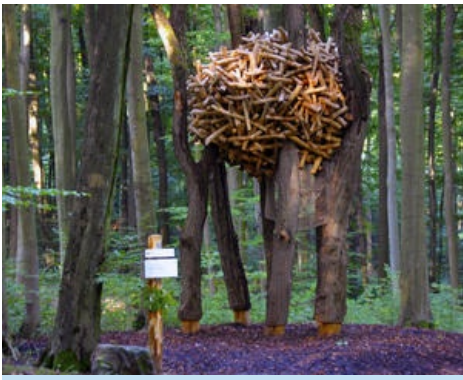
Baumnest - Stadt Ober-Ramstadt