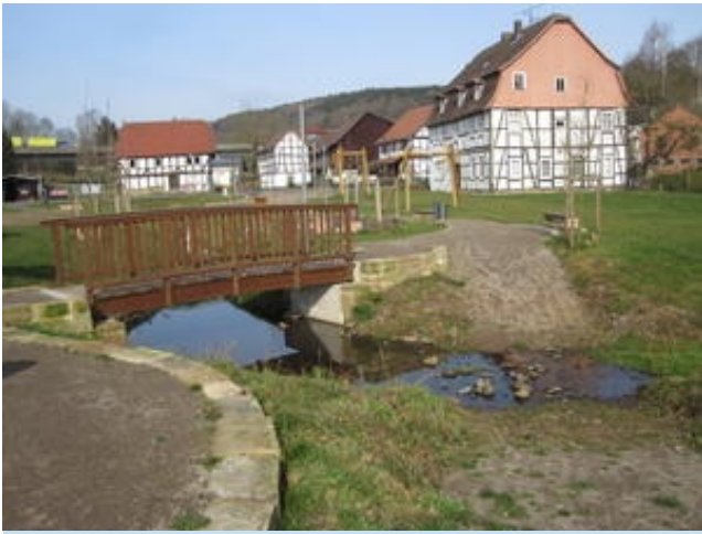
Dorfmitte Asmushausen, Foto: Jens Meister (Stadt Bebra)