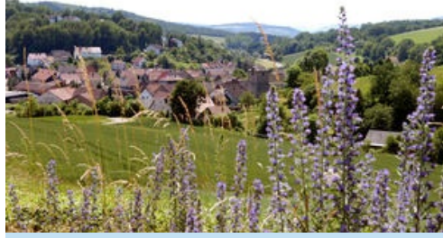
Gilfershausen, Foto: Fotoarchiv Stadt Bebra